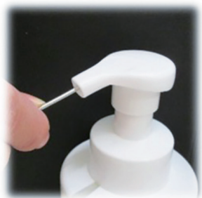
①吐出口の詰まりを綿棒等の棒状のもので除去します。

A 液体石鹸は、使用開始後時間が経つと、ポンプ吐出口の水分が蒸発し乾燥した石鹸成分で目詰まりすることがあります。また、ポンプ本体内部に石鹸カス等が溜まり、ポンプが下がらなくなることもございます。その場合、ポンプを下記の通り洗浄すると解消されます。