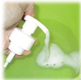
③吸上口を温水につけ、通し洗いをを行います。