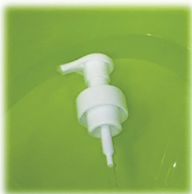
②40℃程度の温水で温めます。